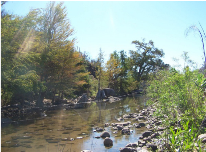
Figura 1. Río Cuchujaqui. Figure 1. Cuchujaqui River.

y por aguas residuales municipales que se descargan al arroyo Álamos, afluente del Río Cuchujaqui. No obstante, se requiere más análisis sobre la disposición de las aguas de desecho y la basura de cada una de las pequeñas localidades ubicadas dentro del Área de Protección de Flora y Fauna (CONANP, 2011). Es por ello que se han realizado estudios de calidad de agua en este sitio tomando como referencia a Méndez, 2009 y Cota, 2010 quienes analizaron la calidad de las aguas de esta cuenca reportando resultados concretos que ayudaron en la toma de decisiones dentro de esta ANP, lo cual sirve como referencia para este y posteriores estudios. Particularmente el objetivo de esta investigación fue determinar las características físico-químicas, microbiológicas y de metales pesados del agua del río Cuchujaqui, humedal de importancia mundial, dentro del APFF-Río Cuchujaqui, para así identificar si existe una relación directa con la calidad del agua y la incidencia de enfermedades de los pobladores.