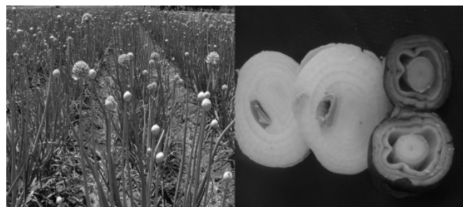
Figura 1. Daño de la emisión de tallo floral en cebolla.

La emisión de tallo floral es un problema que afecta la producción y calidad de la cebolla en México (Figura 1), estimándose el daño hasta un 30% el cual varía de acuerdo a las condiciones climáticas y a la fecha de siembra (Macías y Grijalva, 2006). Por tal motivo, se planteó el presente trabajo de investigación cuyo objetivo fue evaluar el efecto de algunos reguladores de crecimiento sobre la emisión de tallo floral.