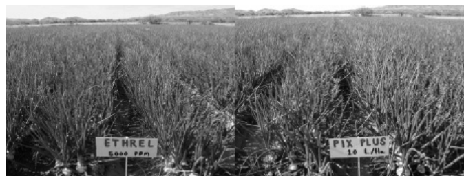
Figura 2. Mejores tratamientos (Ethrel y Pix Plus) para reducir la emisión de tallo floral en cebolla.

Figure 2. Best treatments (Ethrel y Pix Plus) to reduce bolting in onion.